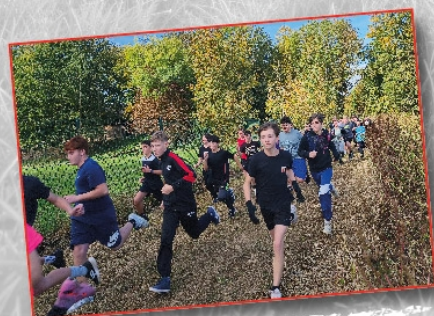
Cross du collège le 17 octobre