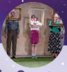
LA CLAIRIÈRE Mar 10 fév 14h15