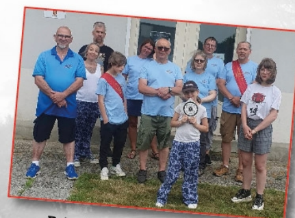
Prix du Roy et du Roitelet de Tir à l'arc, le 22 juin