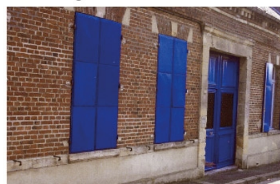
l'ancienne école maternelle

construite et la structure de jeux dans la cour changée.