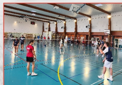
Tournoi de Badminton le 5 octobre