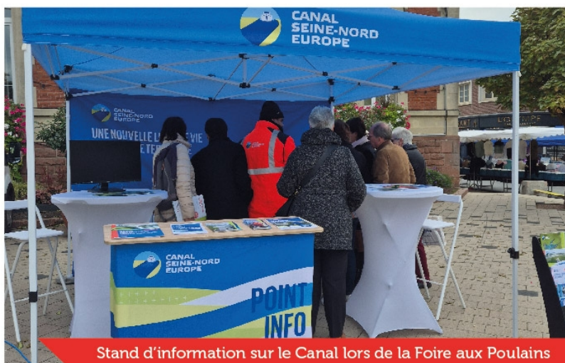
Stand d'information sur le Canal lors de la Foire aux Poulains

À l'approche du lancement des travaux principaux du Canal Seine-Nord Europe, prévu pour 2027, des interventions préparatoires vont se succéder dans l'Est de la Somme, notamment à Nesle. Afin de vous tenir informés de l'avancement du projet et des opérations à venir, la Société du Canal Seine-Nord Europe propose différents moyens de communication.