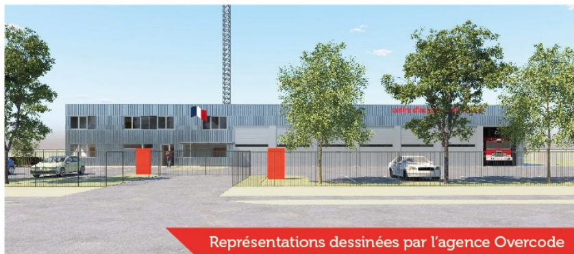
Représentations dessinées par l'agence Overcode