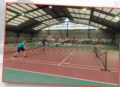
Kermesse du Tennis le 14 juin