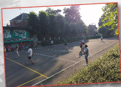
Tournoi des vétérans de Longue Paume, le 13 juin