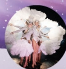
REVUE D'ÉPOQUE DES DIX PAYS EMBLÉMATIQUES Lun 1 er déc 15h