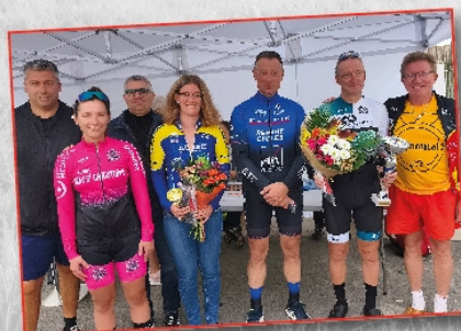
Prix Cycliste de la ville de Nesle le 14 septembre