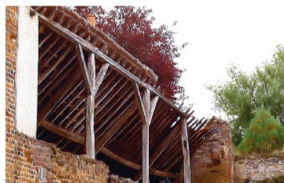
le préau de l'ancienne école maternelle

Cette école porte le nom de Claude Monet du nom du célèbre peintre des Nymphéas. Un projet porté par l'école élémentaire pour donner un nom a été mené en lien avec le nom de l'école maternelle et deux fresques inspirées des tableaux de ce grand artiste ornent maintenant les cours de récréation.