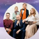
LE PRÉNOM Sam 10 jan 20h30