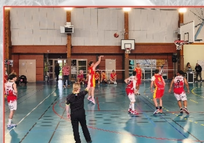
Match de Basket pour Octobre rose le 19 octobre