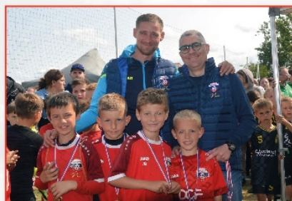
Tournoi de Football / Jeunes le 8 juin