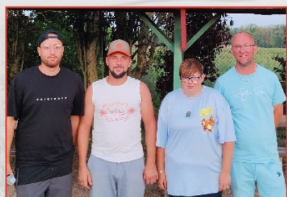
Tournoi annuel de Pétanque le 15 août