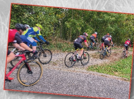
Cyclo Cross de la Résidence du Parc, le 19 octobre