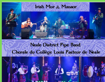
Irish Mor & Manaor, Le Nesle District Pipe Band et la chorale du collège de Nesle